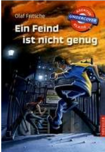
Olaf Fritsche Agentenklasse Undercover Ein Feind ist nicht genug Cecilie Dressler Verlag 2010